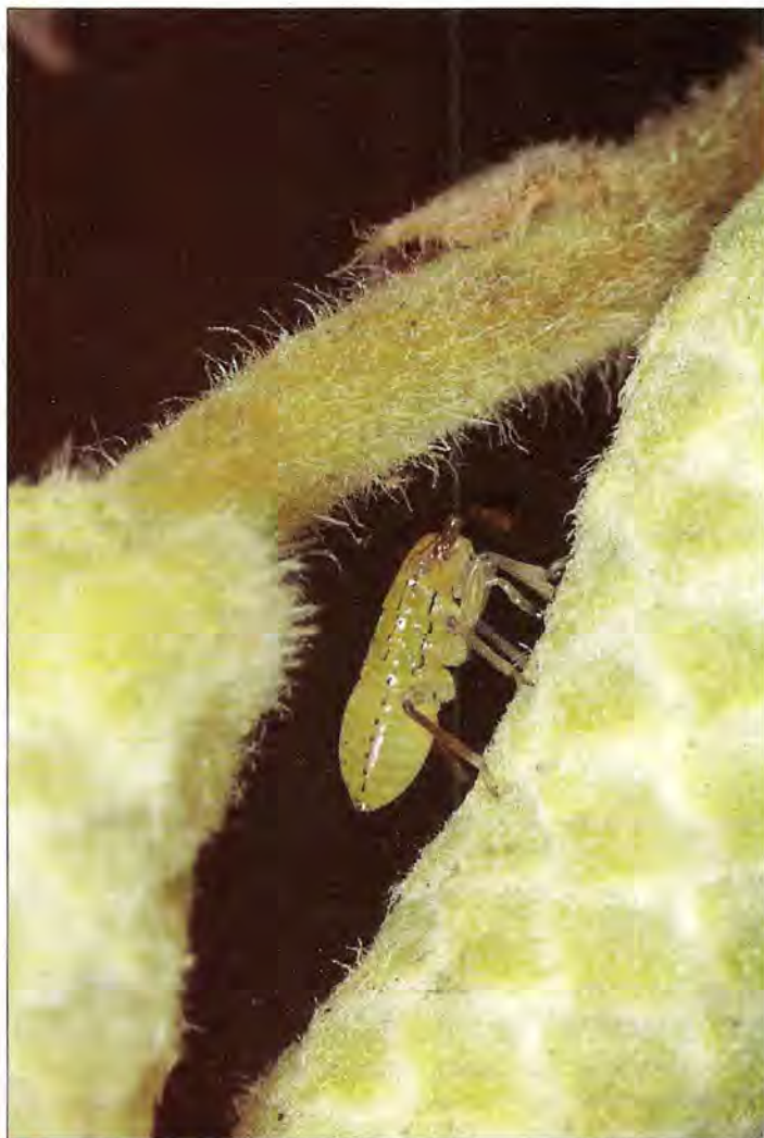
Larve de Pantilius tunicatus s'alimentant sur un chaton au mois de septembre.

au mois de mai et pique les noisettes encore peu lignifiées. L'amande cesse de se développer, c'est l'avortement traumatique des jeunes fruits. La ponte a lieu en juillet. Les larves se nourrissent aux dépens des bractées des involucre. Les nouveaux imagos piquent les noisettes proches de la maturité, provoquant leur dessèchement (noisettes punaisées).