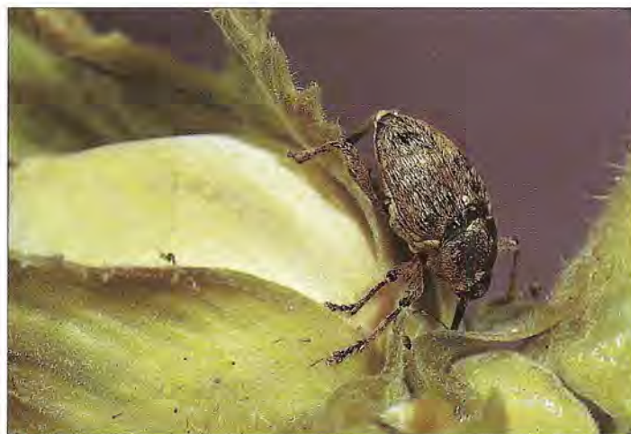
En juillet, femelle de Curculio nucum préparant l'orifice de ponte à la base d'une noisette.

La Punaise des Noisettes, Gonocerus acuteangulatus , beau coréidé de 12 à 15 mm de long est carpophage, comme l'espèce, Coreus marginatus , très fréquente sur les ronces. L'adulte sort d'hivernation