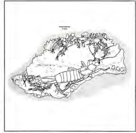
Femelle dans son nid avec jeunes larves et quelques œufs. (Extrait : Ann. Soc. ent. Fr. (N.S.), 6 (3) 1970).

Les perce-oreilles ont choisi une stratégie de reproduction assez originale chez les insectes. Elle consiste en une protection active de la descendance. Chez les espèces ayant évolué vers l'ovoviviparité, solution