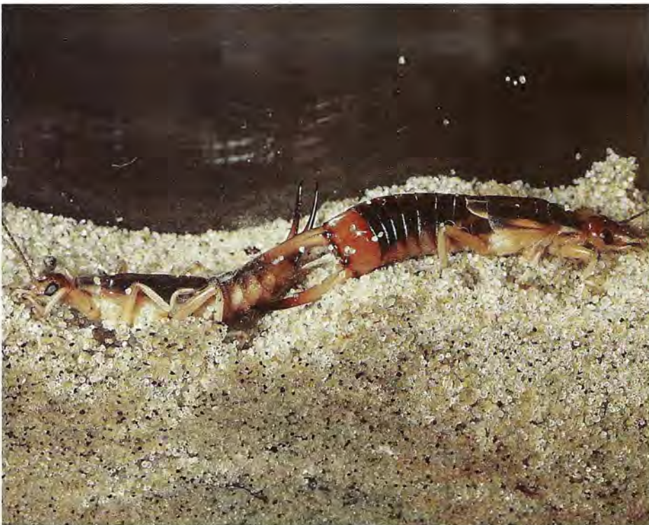
Accouplement de Labidura riparia .

Deux mille espèces cantonnées dans quelques milieux marginaux... sauvées de l'oubli et de l'extinction par... l'amour maternel ! La stratégie de reproduction des perce-oreilles est tout-à-fait originale ; contrairement à la plupart des insectes primitifs, ils n'abandonnent pas leur descendance. La mère soigne et protège ses œufs puis nourrit et guide ses larves.