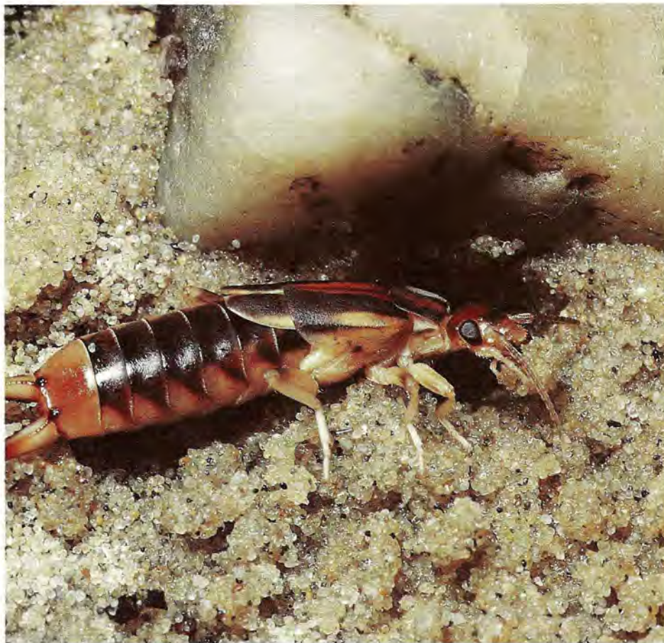
Labidura riparia creusant son terrier.

Ces expériences semblent indiquer que les soins aux œufs se poursuivent grâce d'une part à une substance déposée sur les œufs par la femelle, substance qu'elle détecte par