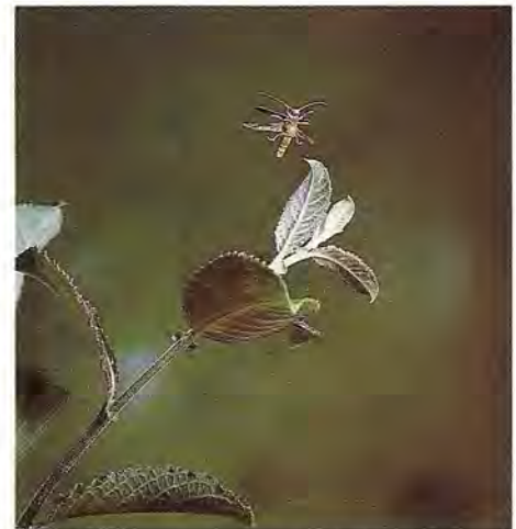
Envol d'un longicorne, Oberea oculata (L), d'un saule (Hasselblad 500 ELUM + Planar 80 mm + bague ; Fujichrome 50 D - sur pied).

Pour ce qui est des Zygoptères, leur vol est, en général, plus lent et donc plus simple à saisir. Il est possible de photographier, sur les plantes aquatiques, les couples qui viennent se poser à la surface de l'eau au