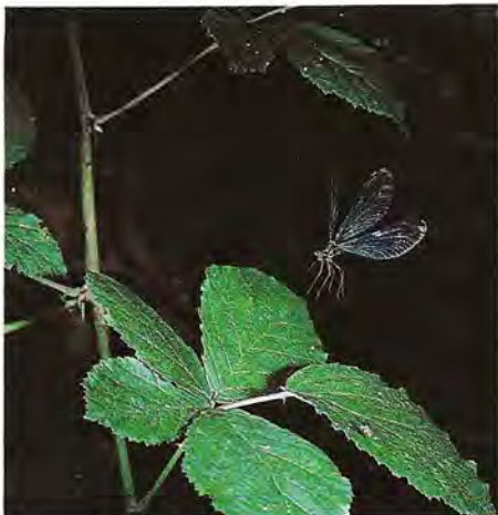
Calopteryx virgo , Calopteryx virgo (L), s'apprêtant à atterrir. (Hasselblad 500 CM + Planar 120 mm + bague ; Fujichrome 50 D - A main levée)

D'autres sont plus faciles à photographier. La coccinelle à 7 points grimpe le long d'une tige, écarte les élytres, déplie les ailes