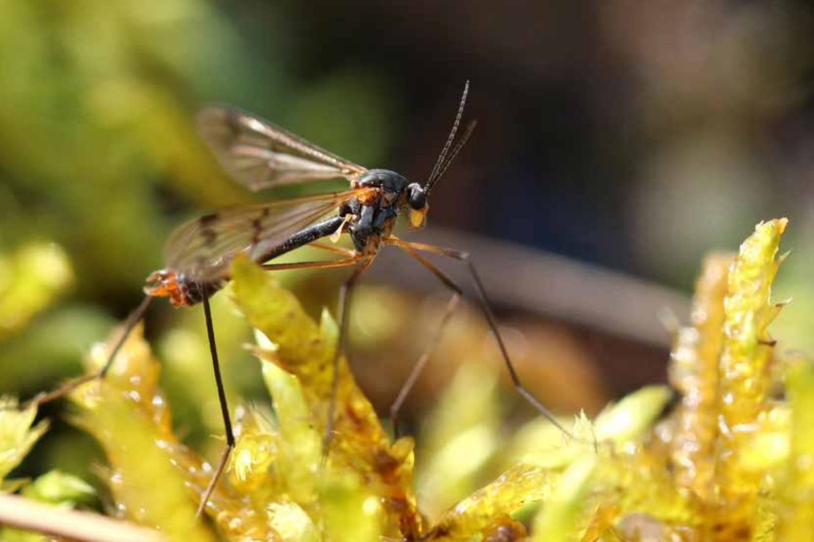
Ptychoptera albimana mâle