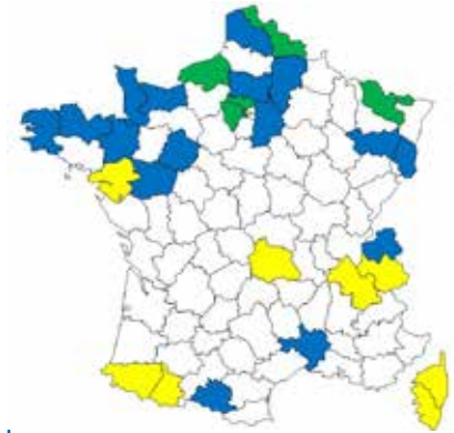
Répartition de Ptychoptera albimana au 30 mars 2018