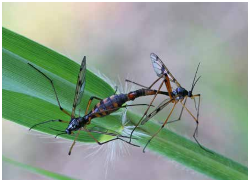
Accouplement de Ptychoptera contaminata . La femelle est à gauche, le mâle à droite.

1- Transmission d'une liste d'observations. Un fichier au format Excel à remplir peut être envoyé sur simple demande ; il facilite le travail des coordonnateurs.