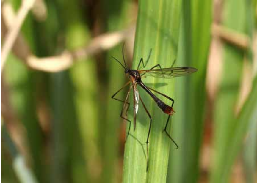
Ptychoptera albimana mâle. Une espèce répandue et assez fréquente en France.