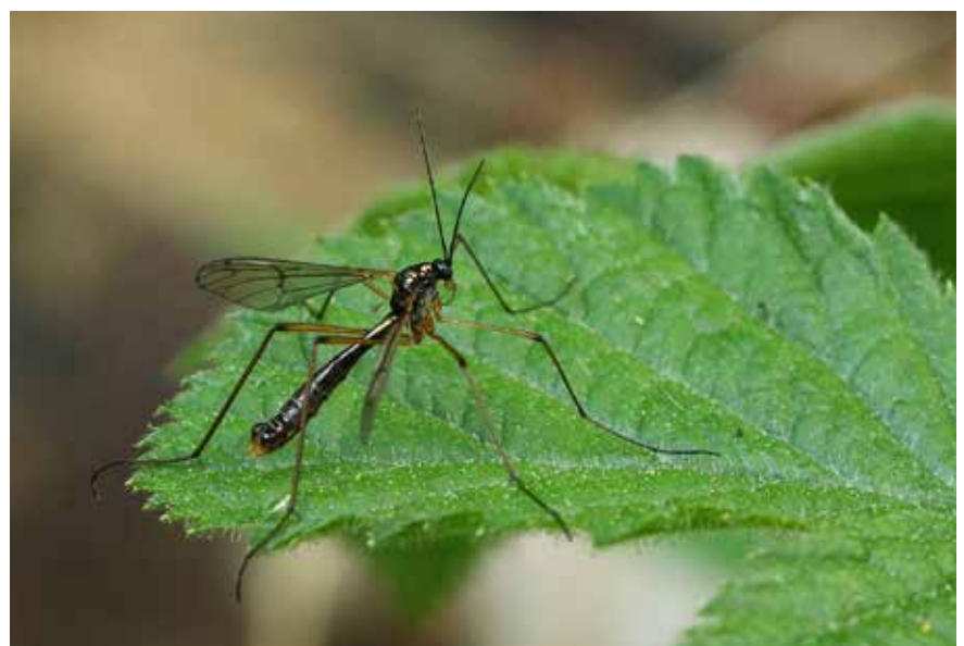
Ptychoptera minuta mâle. Cette espèce n'est connue en l'état actuel des connaissances que d'une seule station française.

Clovis Quindroit (coordinateur scientifique) appt. 103D 20, rue Georgette-Boulestreau 49000 Angers Courriel : clovis.quindroit@etud.univ-angers.fr