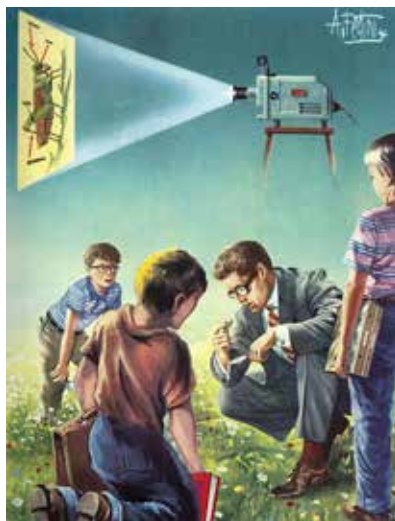
La sortie entomologique.