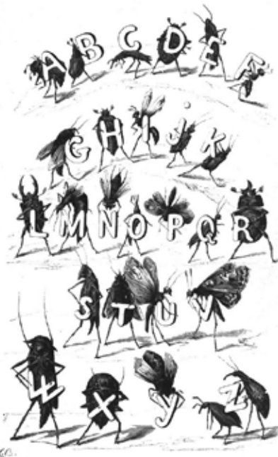
Gravure par F. Méaulle, in : Alphabet des insectes , par Léon Becker, 1883.

Extrait de « La Cigale », Poèmes de Provence par Jean Aicard, 1874.