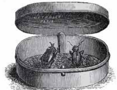
Fig. 113. — Boîte s'ouvrant à ressort.

in : Lamateur de papillons , par H. Coupin, Baillière, 1895.