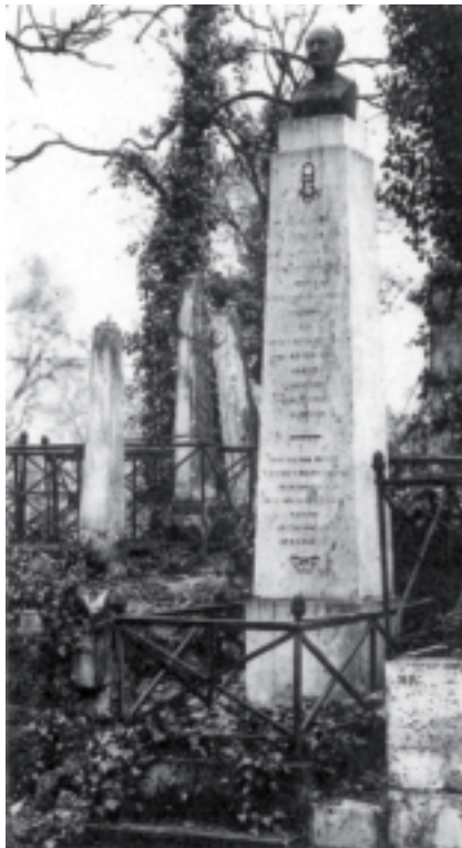
Le tombeau de Latreille au Père Lachaise. In : Livre du centenaire de la S.E.F., 1932

Lamarck, professeur au Muséum d'histoire naturelle de Paris, le prend, comme aide naturaliste, dans sa chaire. Il travaille alors avec acharnement à la rédaction des quatorze tomes de l' Histoire naturelle générale et particulière des Crustacés et des Insectes , qui paraissent de 1802 à 1805 dans le Cours complet d'histoire naturelle connu sous le nom de « Buffon de Sonnini » (ce naturaliste voyageur collaborateur de Buffon), où il applique ses concepts qui seront illustrés et précisés dans son Genera crustaceorum et insectorum... en quatre volumes (1806-1809) qui fonde définitivement sa réputation. Parmi ses nombreux écrits il faut citer : Histoire naturelle des fourmis (1802) ; Considérations générales sur l'ordre naturel des animaux... (1810) ; les articles sur les insectes dans la nouvelle édition du Dictionnaire d'histoire naturelle