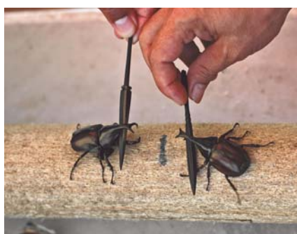
Les deux adversaires sont positionnés