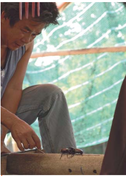
L'action a commencé : les insectes jouent de leur force. L'insecte recule et perd son équilibre.