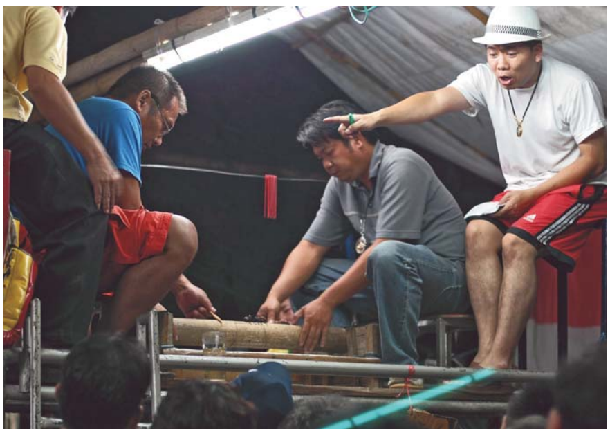
Un « arbitre » peut monter sur la plateforme. Son rôle est de veiller au bon déroulement du combat, mais surtout de stimuler les paris

• Rowland J. M., 2003. Male horn dimorphism, phylogeny and systematics of rhinoceros beetles of the genus Xylotrupes (Scarabaeidae : Coleoptera). Australian Journal of Zoology 51 (3): 213-258.