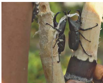
Les scarabées retenus sont examinés sous tous les angles et minutieusement comparés