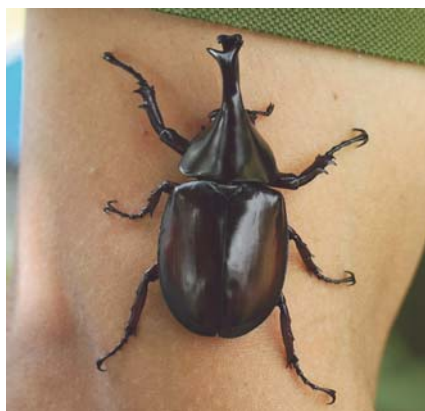
Un animal qui présente une corne pronotale trop courte ou tordue est rejeté