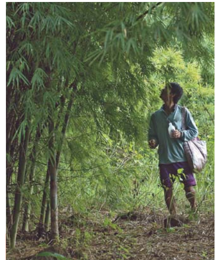
Les collecteurs cherchent les insectes en hauteur

tion, les adultes mâles des Xylotrupes rentrent dans des joutes intrasexuelles dont l'issue détermine l'accouplement avec la femelle. Les nombreux combats de Coléoptères organisés par les Thaïlandais pendant cette période reproduisent dans un dispositif artificiel les conditions de stimulation observées dans la nature : une ou deux femelles sont insérées au