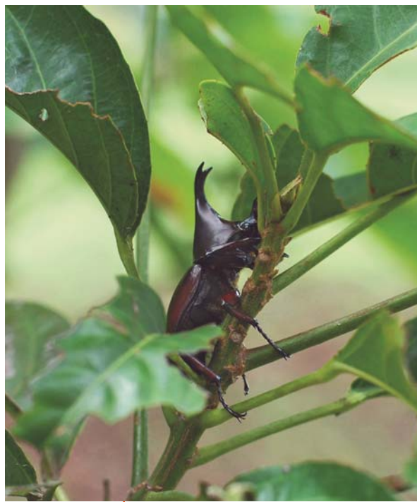
Un Xylotrupes dans la végétation