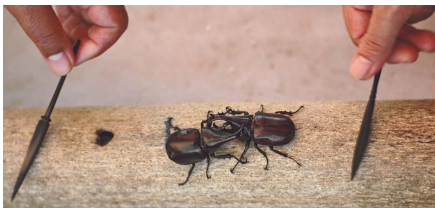
Stimulés par les vibrations des stylets, les adversaires cherchent leur prise

l'aspect de la carapace (thorax et abdomen). D'expérience, les tons unis, le rouge ou le noir, idéalement le jaune, distinguent les meilleurs combattants. La combinaison thorax rouge et abdomen noir, par exemple, est moins recherchée que thorax noir et abdomen rouge. Les rayures longitudinales parfois présentes sur la partie dorsale de l'abdomen sont perçues comme un avantage morphologique. Les « anomalies », dues notamment à un mauvais développement larvaire et nymphal, sont rejetées. L'examen de ces qualités morphologiques ne suffit pas à vérifier les capacités réelles de l'insecte. Seuls ou à plusieurs, les amateurs soumettent le scarabée à plusieurs tests de réactivité : à l'aide, soit d'un stylet, soit du bout du doigt, ils en vérifient les réactions (les « nerfs »). L'animal est observé et manipulé sous tous les angles pour apprécier « en volume » son interaction potentielle avec un adversaire de même morphologie. Une manipulation essentielle consiste à faire fléchir la tête du scarabée pour ouvrir au maximum l'écart entre les deux cornes et ainsi estimer la surface de saisie.