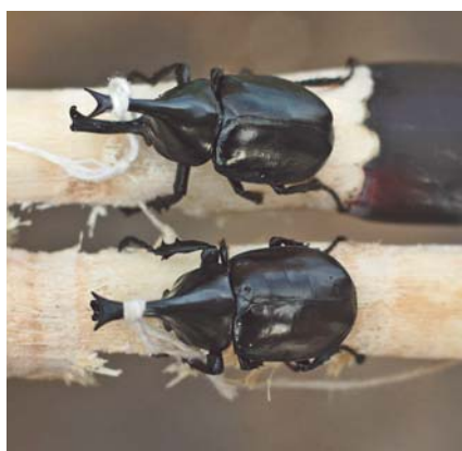
Les anomalies de la carapace peuvent être perçues comme un avantage morphologique