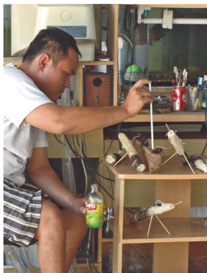
Du jus de fruits vient parfois compléter le régime de canne à sucre des combattants

L'émergence progressive des insectes permet une collecte échelonnée. Les adultes se nourrissant des extrémités tendres des tiges de bambous ainsi que de fruits mûrs, ils sont prélevés principalement dans les bosquets de bambous et les cultures de longaniers ( Dimocarpus longan ), là où ils sont les plus visibles et accessibles. Il suffit alors aux collecteurs de secouer vivement le support de l'insecte pour le voir tomber, puis le ramasser. Certains