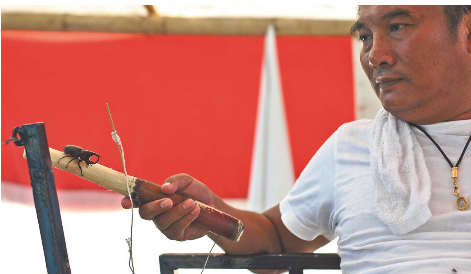
En attendant le combat, un amateur jauge son scarabée