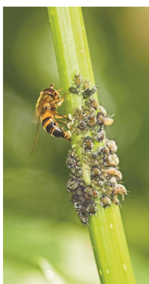
Syrphe déposant ses œufs au milieu d'une colonie de Pucerons noirs du sureau

Vers la fin de l'été, les baies mûres attirent les oiseaux du jardin tels que les fauvettes, les merles, les grives, le