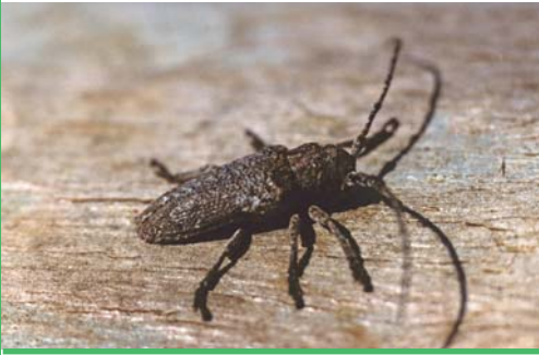
Niphona picticornis