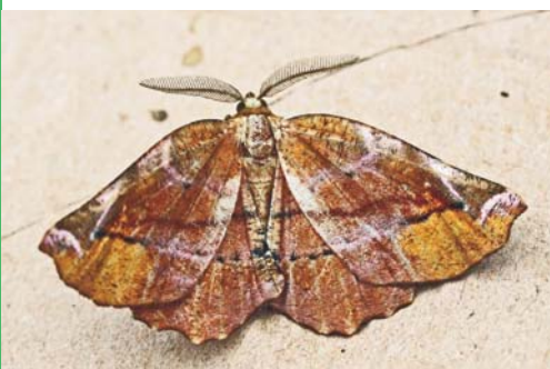
Ennomos du lilas