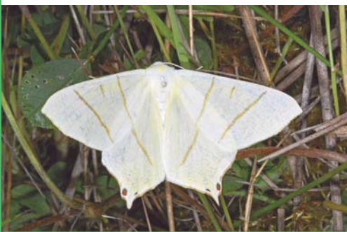
Phalène du sureau