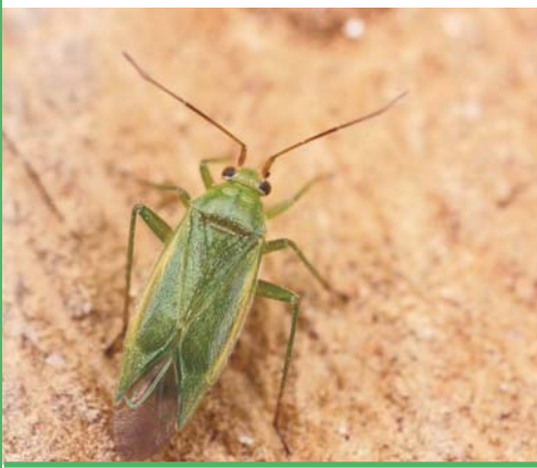
Capside des pousses