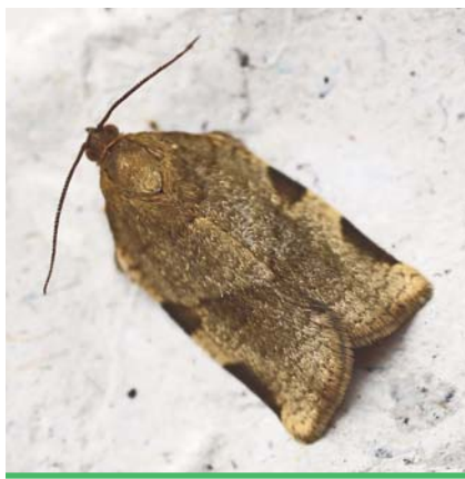
Tordeuse du sorbier

naissance à des larves puis à des adultes qui migrent, à l'automne, vers les bourgeons foliaires où ils hivernent jusqu'au printemps suivant.