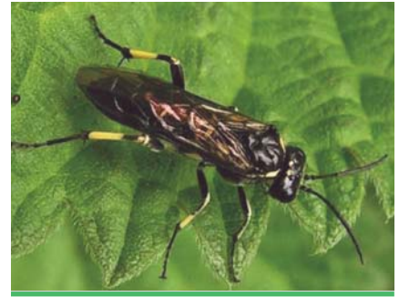
Macrophya albicincta

méridional très commun dont les larves se développent dans les bois morts de diverses plantes hôtes : figuier, orme, châtaignier, chêne-vert et chêne-liège, laurier, etc. Le corps des adultes (12 à 19 mm) est couvert d'une pubescence gris-brun piqueté qui lui donne un aspect terreux. Des dessins gris blanchâtres ornent les élytres. On les trouve d'avril à juin. L'hivernation s'effectue aux stades larvaire ou imaginal, le cycle vital étant de deux ans.