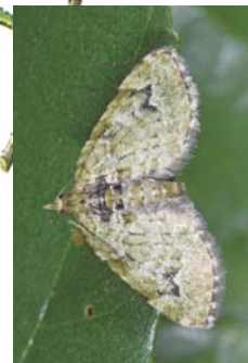
Eupithécie couronnée