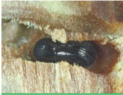
Xylébore disparate femelle creusant sa galerie dans un prunier