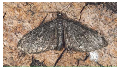
Eupithécie triponctuée