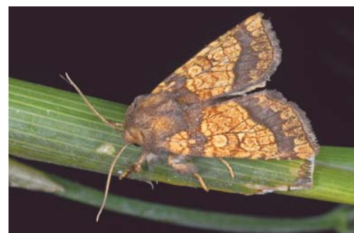
Drap d'or