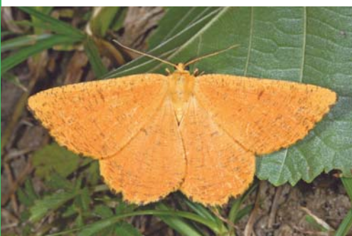
Phalène du prunier mâle