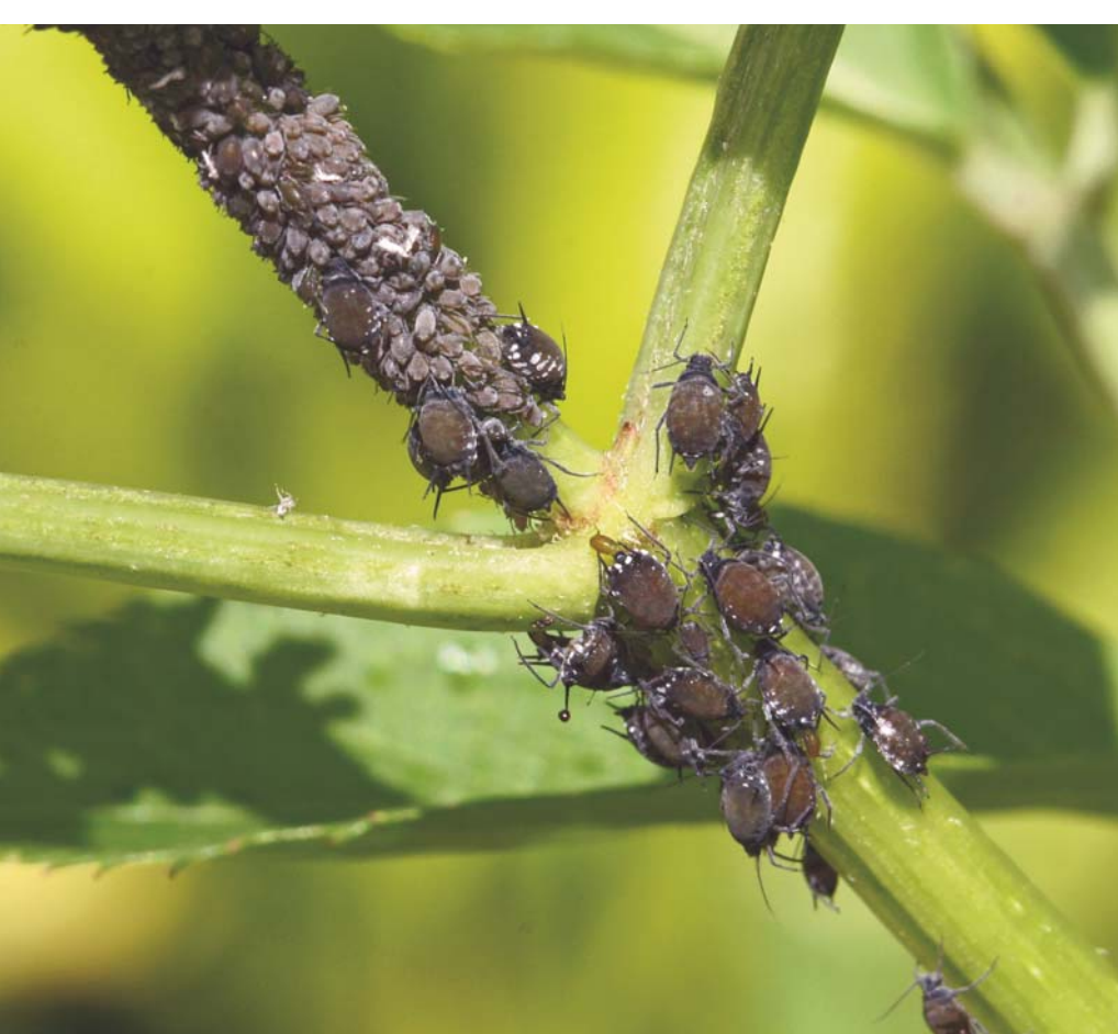
Manchon de Pucerons noirs du sureau