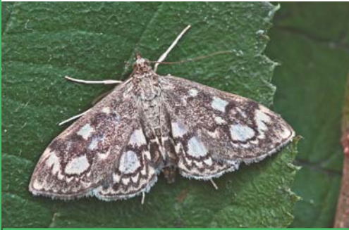
Pyrale du sureau