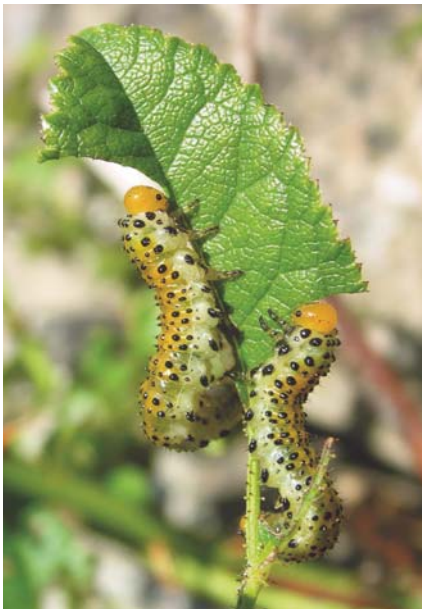
Larves d' Arge pagana sur églantier