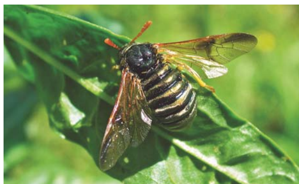
Abia sericea femelle