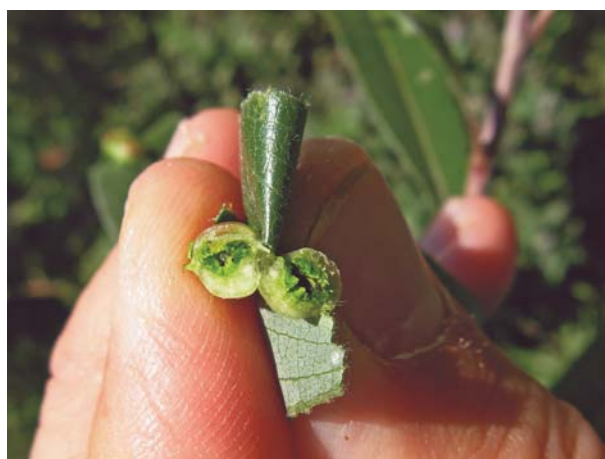
Galle de Pontania proxima sur saule blanc. À droite, la larve dans la galle coupée

ponte : rangées d'incisions parallèles dans lesquelles les œufs étaient introduits ( Nematus miliaris ) ou déposés sous les feuilles en petits groupes, les œufs bien visibles à peine coincés dans le limbe ( N. salicis ). Si elles sont unicolores et que l'on ignore la plante-hôte, il est quasiment impossible de les nommer.