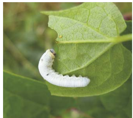
Larve de Monostegia oldomiveralis sur lysimaque

Près de 80% des tenthrèdes photographiées n'étant pas identifiables à l'espèce, il est indispensable d'avoir recours à un spécialiste. Même les grands sirex au corps jaune et noir ( Urocerus gigas , U. augur et U. fantoma ) ou au corps noir à reflets plus ou moins bleutés ( Sirex juvencus , S. cyaneus et S. noctilio ), ne sont distinguables que par la longueur relative de la tarière et de la plaque anale. Quant aux larves, si elles sont grégaires, il est utile d'en prélever 3 ou 4 pour tenir compte d'une éventuelle variabilité morphologique et de préciser, si possible, l'emplacement de la