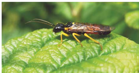
Pamphilius hortorum posé sur une feuille de ronce