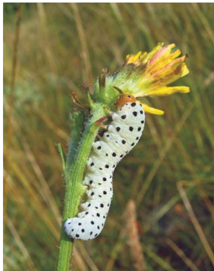
Larve de Cephaledo neobesa sur épervière