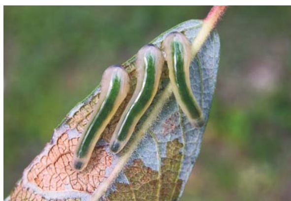
Larves de Caliroa annulipes sur saule cendré