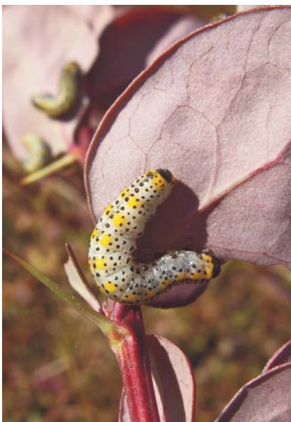
Larve d' Arge berberidis sur un Berberis ornamental

soleil ou qui butinent et s'accouplent sur les fleurs d'ombellifères, de renoncules, composées et euphorbes particulièrement attractives. Certaines espèces sont étroitement liées à un stade de