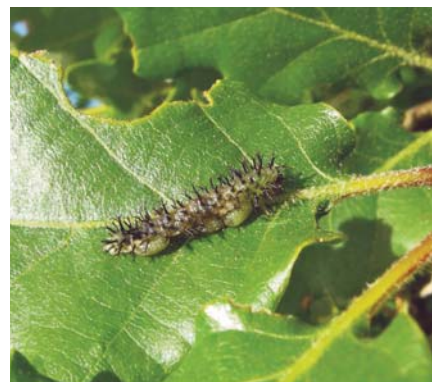
Larve de Periclista pubescens parasitée