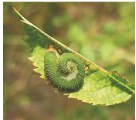
Larve d' Allantus viennensis sur églantier