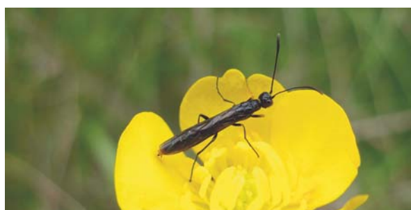
Calameuta filiformis sur renoncule

Elles sont, pour la plupart, unicolores, vert pâle, blanchâtres ou brunâtres, certaines couvertes d'épines molles ( Periclista sp.), à la peau visqueuse comme la Tenthrede limace ( Caliroa cerasi ), jonchées de poudre blanche ( Monostegia sp., Eriocampa sp.) ou encore avec des taches ou des points noirs dont la disposition est très souvent caractéristique de l'espèce (Nematinés diverses, par exemple).