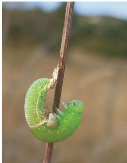
Larve de Dolerus effectuant sa mue sur jonc