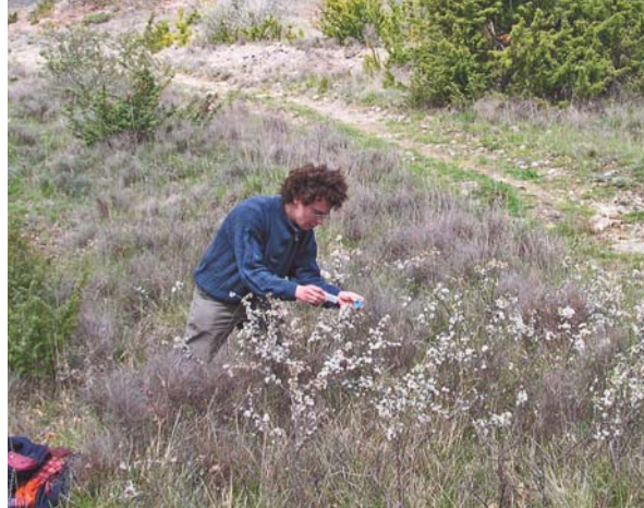
Collecte d' Hoplocampes sur prunelliers en fleurs