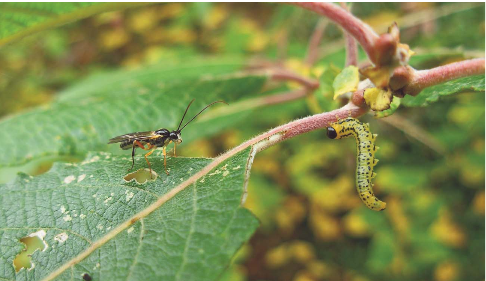
Larve d' Hypolaepus pavidus sur saule marsault guettée par son principal parasite, L'Ichneumonidé Rhorus extirpatorius

Par Lucas Baliteau et Henri Chevin