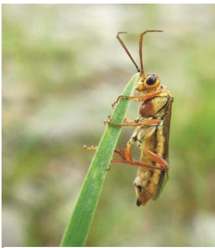
Femelle de Tenthredopsis sordida