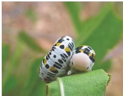
Larve de Palaeocimbex quadrimaculata