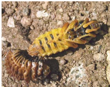
Nymphe de P. quadrimaculata

En combinant les compétences de plusieurs entomologistes, entre terrain et laboratoire, ces techniques d'inventaire ont permis de lister plus de 200 espèces de mouches à scie sur le département de l'Aveyron. ■