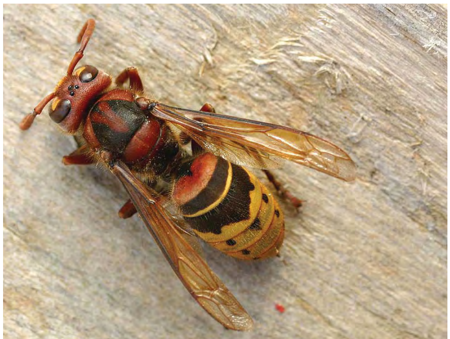
Le Frelon européen Vespa crabro - © Entomart à http://home.tiscali.be/entomart.ins/

mais exceptionnellement, dans les creux de murailles ou dans une cavité du sol. Le plus souvent, il façonne son nid dans la frondaison des grands arbres, et on ne le repère alors qu'au bruit produit par les allées et venues des ouvrières dans le feuillage (mais, aux dires de nombreux observateurs, il se déplace en vol beaucoup plus discrètement que le Frelon d'Europe) ou seulement en automne lorsque l'arbre a perdu ses feuilles. Lorsqu'il s'installe dans un espace bien dégagé (habitation, arbre au port étalé), le Frelon asiatique est un artiste qui façonne un magnifique nid de papier dont la forme, quasiment circulaire, est très caractéristique. La paroi du nid, formée de larges écailles de papier striées de beige et de brun, est très fragile. Le diamètre