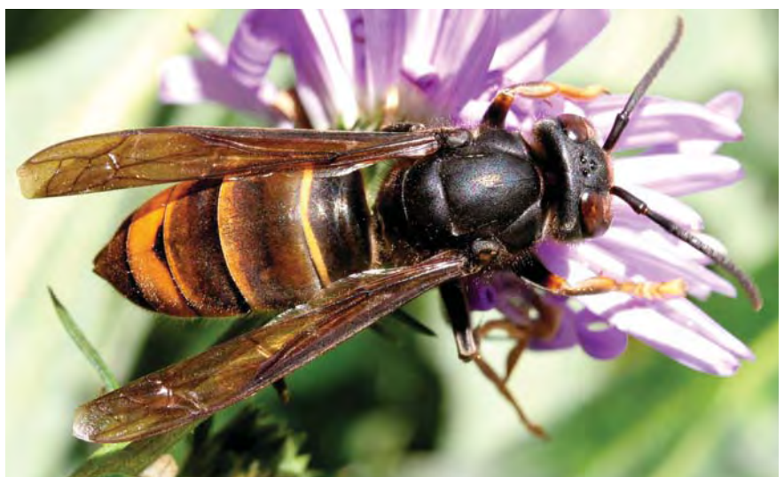
Frelon asiatique sur fleur d'aster à Agen (Lot-et-Garonne), octobre 2006

V. velutina a été décrit par Lepeletier en 1836 à partir de spécimens collectés dans l'île de Java (Indonésie). Le spécimen ayant servi à la description de l'espèce est conservé dans les collections du MNHN. V. velutina est présent dans une grande partie du sud-est asiatique : nord de l'Inde, Bouthan, Myanmar, Thaïlande, Laos, Vietnam, sud-est de la Chine, Corée du Sud, Taïwan, Péninsule malaisienne et archipel indonésien. Sa coloration extrêmement variable permet de distinguer onze sous-espèces.