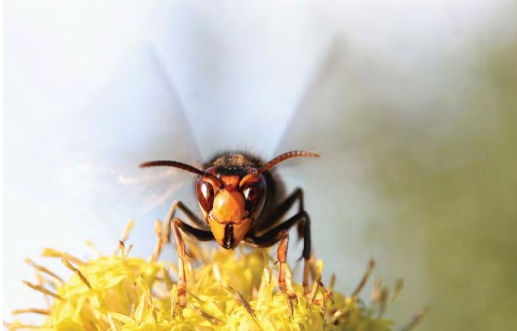
Frelon asiatique sur une fleur d'aster Lynosyris vulgaris