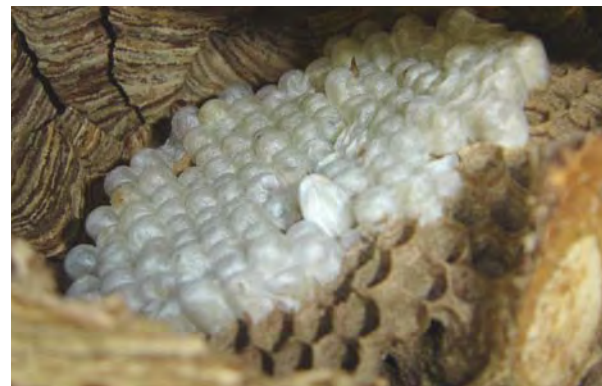
Intérieur d'un nid du Frelon asiatique découvert à Pujols (Lot-et-Garonne)