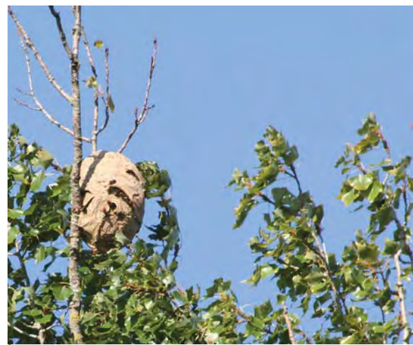
Nid de Frelon asiatique dans un peuplier noir

■ Jean-Claude Streito Laboratoire national de la protection des végétaux - Unité d'entomologie ENSAM-INRA Zoologie - 2, place Viala 34060 Montpellier cedex 01