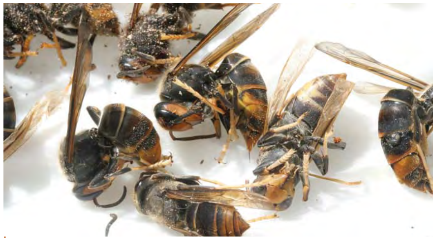
Vespa velutina morts après gavage de nid, La Croix Blanche (Lot-et-Garonne), juillet 2006.

d'une caméra thermique : le frelon agresseur est rapidement entouré d'une masse compacte d'ouvrières qui, en vibrant des ailes, augmentent la température au sein de la boule jusqu'à ce que leur adversaire meure d'hyperthermie (photo) ! Au bout de cinq minutes, la température ayant atteint 45 °C, le frelon succombe mais pas les abeilles, qui sont capables de supporter plus de 50 °C. Cette méthode est très efficace mais, trop souvent répétée, elle entraîne l'affaiblissement de la ruche car les ouvrières consacrent alors moins de temps à l'approvisionnement. En Asie, l'élevage de l'Abeille domestique d'Europe, Apis mellifera , s'est développé progressivement depuis une cinquantaine d'années et cette espèce est désormais largement répandue dans la région. Elle emploie le même moyen de lutte, mais son adaptation au prédateur étant plus récente, sa défense est moins efficace : la boule autocuiseuse d' A. cerana rassemble en effet une fois et demi plus d'ouvrières que celle d' A. mellifera .