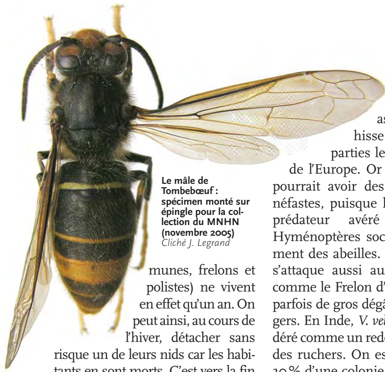
Le mâle de Tombeboeuf : spécimen monté sur épingle pour la collection du MNHN (novembre 2005)

munes, frelons et polistes) ne vivent en effet qu'un an. On peut ainsi, au cours de l'hiver, détacher sans risque un de leurs nids car les habitants en sont morts. C'est vers la fin de l'été que les femelles reproductrices de la nouvelle génération quittent le nid en compagnie des mâles pour s'accoupler ; elles survivront seules à l'hiver tandis que mâles et ouvrières meurent. Au printemps, chaque reine fondatrice ébauchera un nouveau nid, pondra quelques œufs et soignera ses premières larves qui deviendront des ouvrières adultes (femelles stériles) capables de prendre en charge la construction du nid et l'entretien de la colonie.