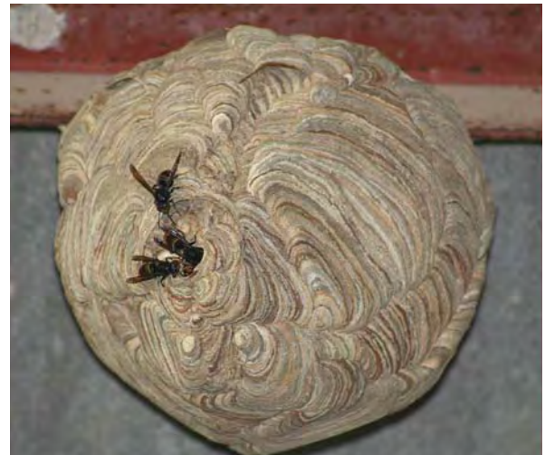
Nid parfaitement sphérique du Frelon asiatique installé sous un toit à Bourrant (Lot-et-Garonne), août 2006