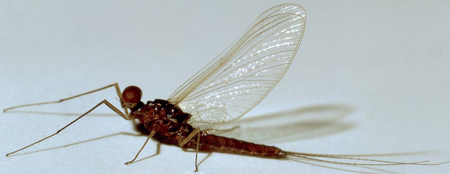
Imago mâle reconnaissable à ses yeux très développés