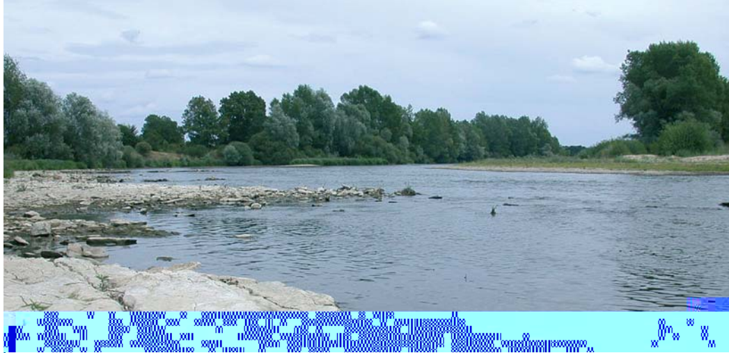
Un exemple de cours d'eau à Serratella (affleurement calcaire du Bec d'Allier)