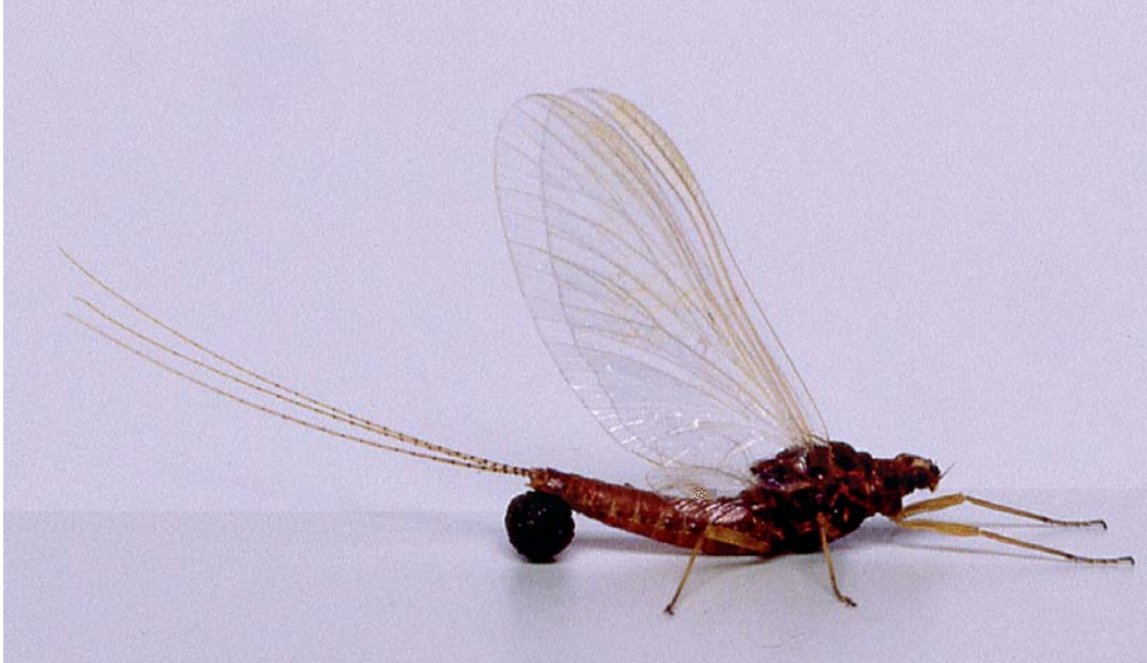
Imago femelle et sa masse d'œufs qu'elle larguera en une fois au-dessus de l'eau

rieur, de chaque côté de la médiane, une forte saillie en plus des processus latéraux dirigés vers l'arrière. Les tergites III à VII portent une paire de trachéobranches en position dorso-latérale, chaque branche recouvrant plus ou moins la suivante. S. ignita se distingue des autres Éphémérellidés par la forme des branches relativement pointues. L'abdomen est prolongé par trois filaments caudaux, cerques et paracerque, garnis de soies raides, annelés avec alternance de deux anneaux sombres et de deux anneaux clairs. La coloration d'ensemble est brunâtre avec des mouchetures sombres plus ou moins marquées, en particulier sur les pattes. On constate que les individus des stations d'altitude sont plus petits et plus fortement colorés que ceux des stations de plaine (respectivement 6 et 8 mm). On remarque toutefois une grande variabilité de la pigmentation au sein d'une même population. Les larves de tous les Éphémérellidés prennent une attitude particulière quand elles sont dérangées : abdomen et cerques sont dressés à la verticale du corps, évoquant ainsi la défense du scorpion. La larve se nourrit essentiellement de diatomées récoltées sur les supports qu'elle fréquente. Sur la larve de dernier stade, appelée abusivement « nymphe », les sacs alaires prennent une coloration noirâtre caractéristique. Le sexe de l'insecte peut alors être déterminé grâce aux ébauches des organes génitaux,