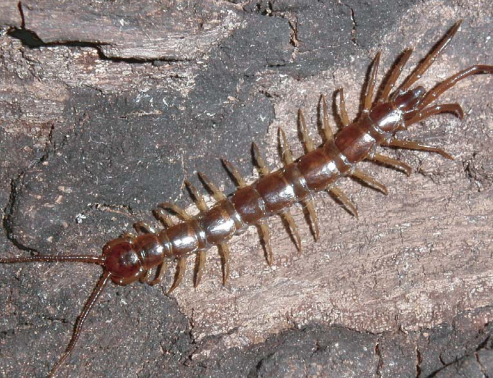
La Lithobie à pinces.