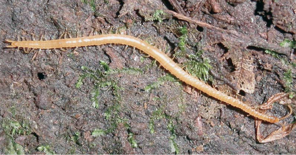
Un Géophilomorphe : Strigamia crassipes (C. L. Koch, 1835) (Linotaeniidé)