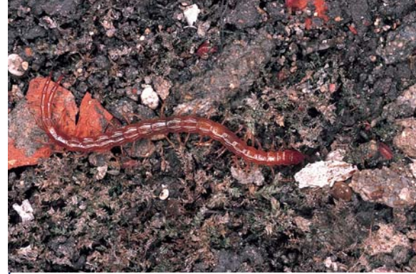
Un Scolopendromorphe : Cryptops sp. (Cryptopidé).

qui peut s'observer aussi bien près des habitations (tendance synanthropique) qu'en pleine forêt de feuillus ou de conifères, dans les cultures, les prairies et pelouses mésophiles, voire xéro-thermophiles, cette espèce étant assez tolérante envers une humidité relativement faible. À l'instar des autres Chilopodes, tous prédateurs, elle possède un appareil inoculateur de venin, les forcipules, reliquat d'une paire