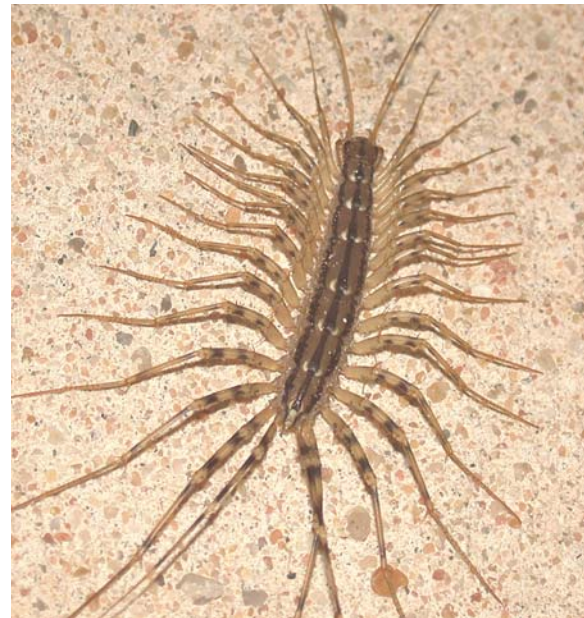
Un Scutigéromorphe : Scutigera coleoptrata (Linné, 1758) (Scutigéridé).

de pattes modifiées (fig. 1). Les membres forcipulaires, composés de quatre articles (fémoroïde, tibia, métatarse et tarse porteur de la griffe forcipulaire densément sclérifiée), sont placés sous la capsule céphalique et forment une sorte de tenaille acérée. Ils s'articulent ventralement sur le coxosternum forcipulaire, pièce ventrale du segment forcipulaire situé juste après la tête. La majeure partie de la glande à venin est contenue dans le fémoroïde. Un sphincter commande l'éjection du venin par le canal excréteur, qui débouche dorsalement sur la griffe forcipulaire par un petit orifice préapical. Le venin de L. forficatus est létal pour la plupart des petits Arthropodes ; Aranéides et Coléoptères y sont particulièrement sensibles. En plus de cette arme chimique, la Lithobie est capable de se déplacer rapidement (144 cm/min, d'après Demange, 1981) !