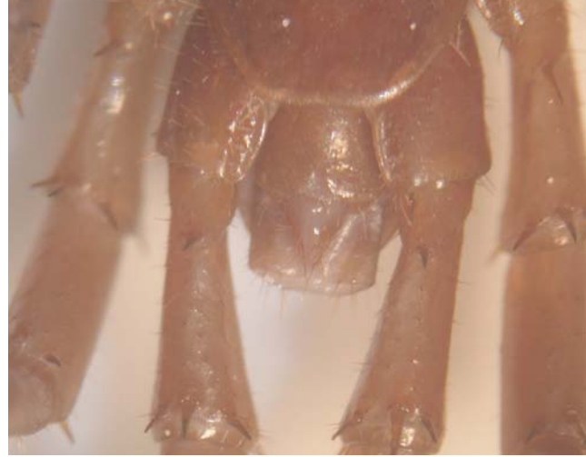
Gonopodes femelle (à gauche) et mâle (à droite) de Lithobius forficatus