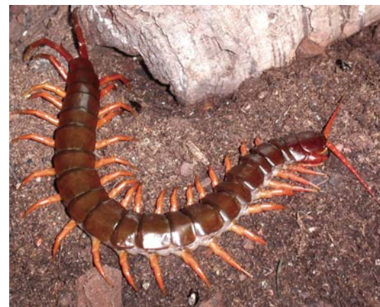
Scolopendromorphe tropical.

nos régions qui n'excèdent jamais quelques dizaines de millimètres. Dans le Midi, on rencontre la Scolopendre annelée, Scolopendra cingulata qui atteint une dizaine de centimètres. Sa morsure peut provoquer chez l'Homme enflure et forte douleur, voir de la fièvre.