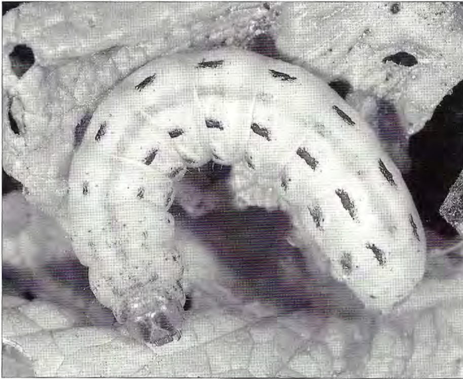
Agrotis pronuba , (Cliché R. Coutin - OPIE)

Les imagos vivent deux mois ; il y a deux à quatre générations par an. C'est une espèce qui semble préférer Rumex crispus , R. aquaticus et Polygonum aviculare , la Renouée des oiseaux.