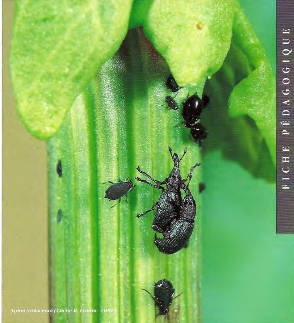
Apion violaceum (Cliché R. Coutin - OPTE)

L es Oseilles appartiennent au genre botanique Rumex , terme latin qui désignait le caractère piquant lié à la forme des feuilles de la plupart des espèces du genre. Le mot oseille s'est écrit successivement : oiselles au XI e siècle, puis osile, vers 1250 ; et enfin : ozeille, à la fin du XIV e siècle. Ces diverses formes orthographiques dérivent du latin acidula et aussi : oxalis , lui-même dérivé du grec : oxus , qui signifiait une qualité aiguë, acide (cf. oxygène). Certaines espèces d'oseilles sont appelées patience , terme qui vient du latin lapatium , lapacium , transcription du grec : lapathon , (Théophraste : Hist. des plantes, écrite entre le IV e et le III e siècle av. J.C.). Ce nom, tiré du verbe lapassein , désignait une sorte d'oseille laxative. En grec, ce verbe signifie : vider, en raison de l'effet laxatif produit par l'ingestion de ses feuilles. Les termes communs désignant les oseilles en anglais et en allemand sont les suivants : "Sorrel" et "Sauerrampfer". Le genre Rumex est représenté en France par 26 espèces dont 11 possèdent une saveur acide alors que les 15 autres en sont dépourvues.