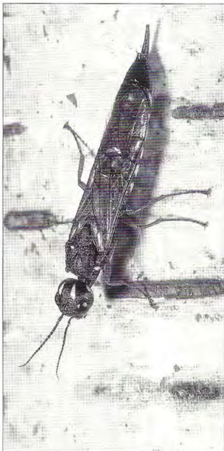
La larve du Sirex du bouleau, Xiphydria camelus , fore des galeries dans les branches accélérant ainsi leur décrépitude.

fausses-pattes. La nymphose a lieu dans un cocon brun-rougâtre en forme de tonneau. Une tenthrède de petite taille, 5 à 8 mm, Hemichroa crocea , dont la femelle est parthénogénétique, insère ses œufs sur deux rangées dans les pétioles. Les larves font d'abord des trous en forme de sigma dans les feuilles, avant de les consommer en totalité. Les larves des deux générations tissent un cocon dans le sol et s'y nymphosent. Le feuillage est parfois totalement dévoré par une autre tenthrède, fréquente sur les tilleuls, Caliroa annulipes , du groupe des tenthrèdes-limaces. L'espèce la plus dommageable est Croesus latipes , responsable en mai-juin de défoliations parfois totales. Les larves ont un comportement fort curieux : elles consomment le bord des feuilles, se tenant seulement par leurs pattes thora-