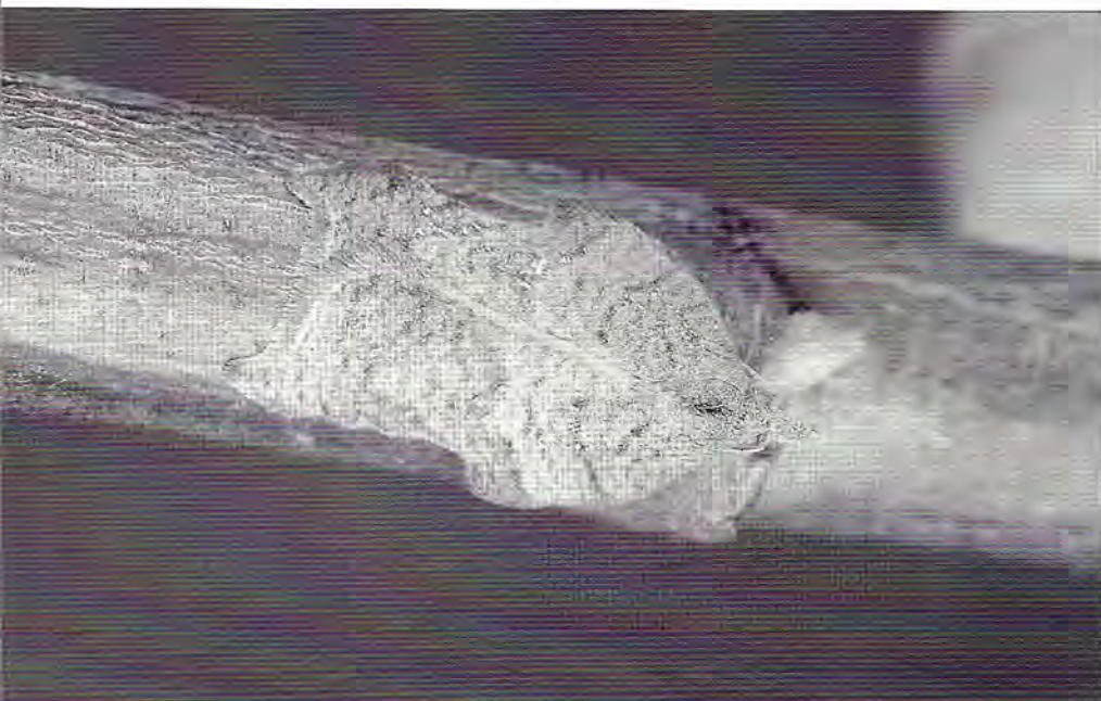
Acleris emargana est une tordeuse très curieuse mais peu fréquente.

Cinq Cécidomyies, dont les manifestations sont discrètes, vivent sur les feuilles et les chatons femelles. Les deux plus communes sont : Anisostephus betulinum , qui est à l'origine de galles sphériques sur les deux faces des feuilles et Semudobia betulinae qui déforme les chatons. La première se nymphose dans le sol ; la seconde dans les chatons, à la base des écailles portant les graines. À signaler aussi une mouche à larves mineuses, Agromyza alnibetulae , qui s'attaque surtout aux jeunes sujets. Sa larve orange mine les feuilles.