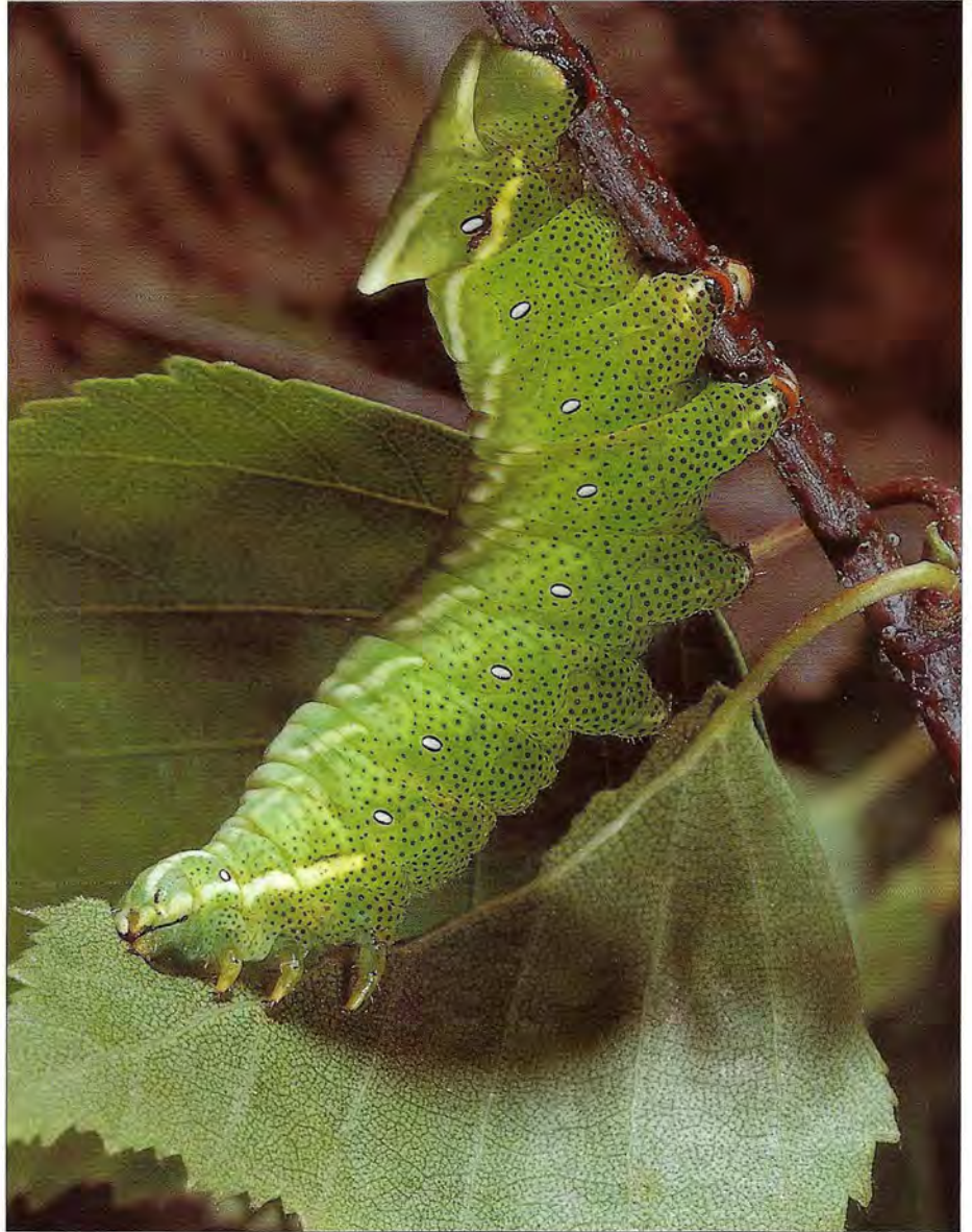
En mai, la chenille d' Endromis versicolora termine sa croissance. Puis, elle se nymphosera et le papillon n'apparaîtra qu'en mars, l'année suivante.

Plusieurs Hyménoptères sont à l'origine de quelques déprédations. Les arbres affaiblis, malades, ou récemment plantés, ainsi que les aulnes, sont particulièrement attractifs pour les femelles du Sirex du bouleau, Xiphydria camelus . À l'aide de son ovipositeur, la femelle introduit ses œufs sous l'écorce ; puis les larves forent leurs galeries dans des rameaux de diamètre moyen. Leur croissance s'étend sur deux saisons de végétation. La nymphose a lieu dans le rameau. Une grosse espèce de Symphyte, Cimbex femoratus , caractérisée par son corps puissant et ses antennes claviformes, vole de mai à juillet. La femelle introduit ses œufs dans les pétioles. En juillet et août les grosses larves dévorent les feuilles. Au repos, elles se tiennent enroulées en spirale, accrochées aux feuilles par leurs pattes et leurs